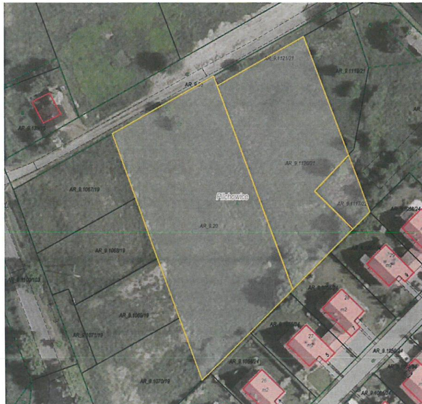
Rysunek 1 Działki przeznaczone do sprzedaży zaznaczona kolorem żółtym

Dla przedmiotowych działek objętych sprzedażą nie wykonano badań geotechnicznych, ani badań stopnia zanieczyszczenia gleby. Zatem sprzedawca nie ponosi odpowiedzialności za ewentualne negatywne skutki wyników tych badań.